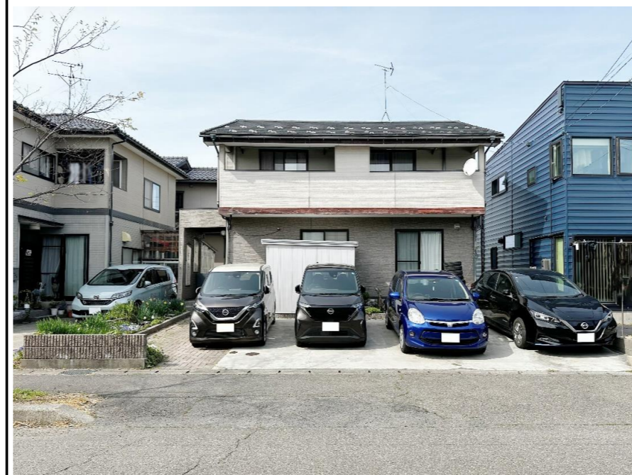
※物件資料と現況と異なる場合がありますが、その場合現況を優先致します。