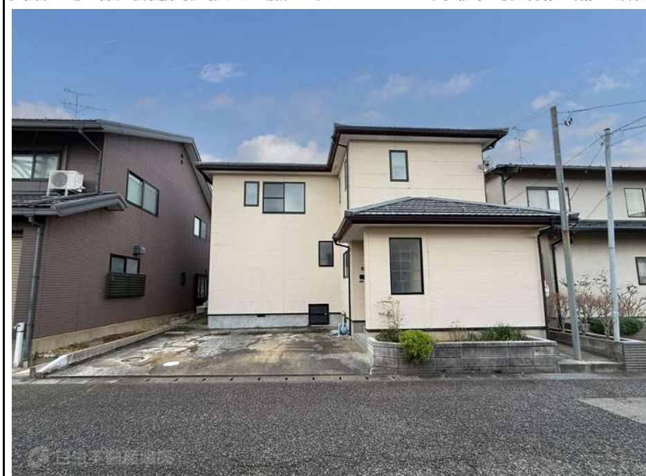
※物件資料と現況と異なる場合がありますが、その場合現況を優先致します。