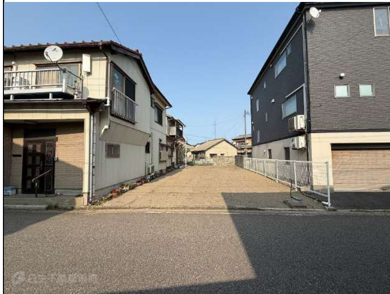
※ 各種情報と現況に差異がある場合は、現況を優先させて頂き