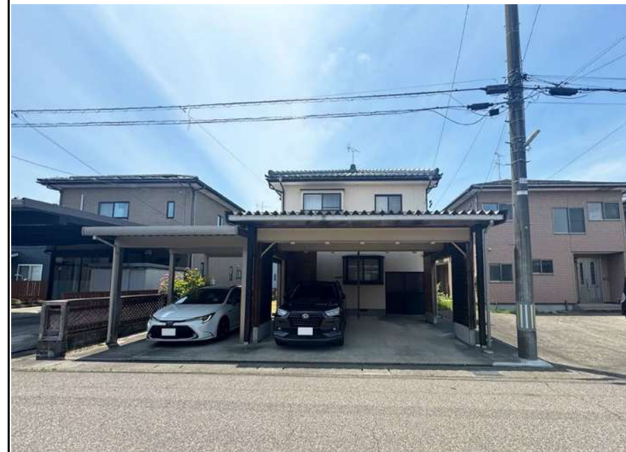
※物件資料と現況と異なる場合がありますが、その場合現況を優先致します